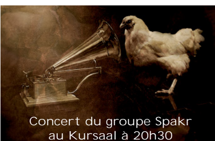
Concert du groupe Spakr au Kursaal à 20h30